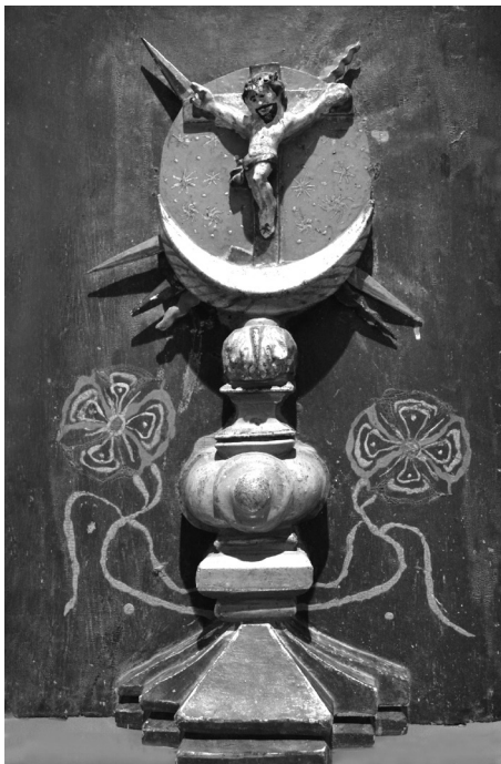
Figura 2: Restos de la puerta del sagrario, a modo de custodia, de la iglesia del pueblo de Corpus Christi que se incendió en 1817 y que actualmente se conserva en una casa familiar en Loreto, Corrientes (Argentina). Fuente: fotografía del autor (2016).