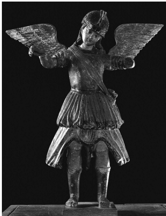
Figura 3: San Miguel procesional. Madera tallada y policromada de 77 cm de alto. Data del siglo XVII, antes de la desafortunada intervención de 2005-2006.