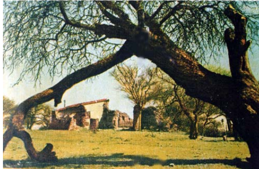
Fig. 2 Vista del conjunto en 1961 en que se observa que aun estaba en pie buena parte del conjunto.

La Formación de una Ruina Histórica : O como la Estancia Jesuítica de San Ignacio paso a ser Arqueológica (Cordoba, Argentina).