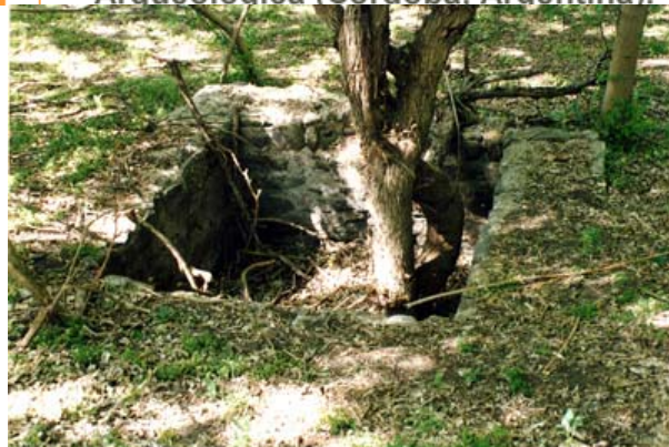
Fig. 8 Construcción cuadrada, posible jaguel conservado completo (2003)

La Formación de una Ruina Histórica : O como la Estancia Jesuítica de San Ignacio paso a ser Arqueológica (Cordoba, Argentina).