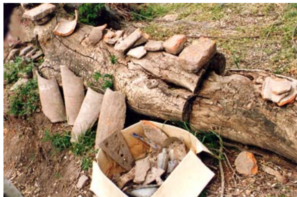
Fig. 11 Objetos, tejas y ladrillos abandonados en el sitio después de la destrucción de 1998.