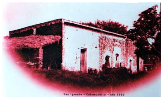
Fig. 4 Sector completo aunque sin galería de la construcción principal de la estancia en la década de 1950.