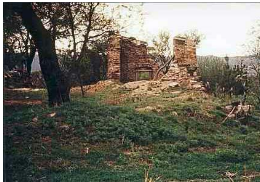
Fig. 3 Uno de los edificios en 1962 con derrumbe reciente del muro posterior.