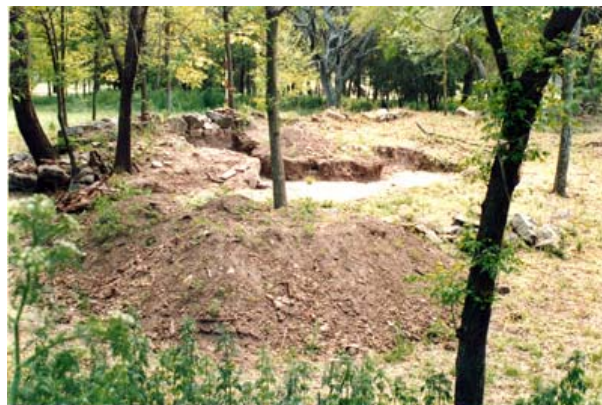
Fig. 9 Sector central de la iglesia saqueado en 1998 por los propietarios.