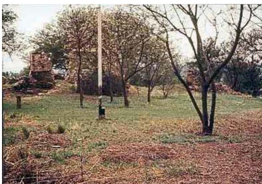
Fig. 6 Vista general en la década de 1960 de uno de los edificios mayores.