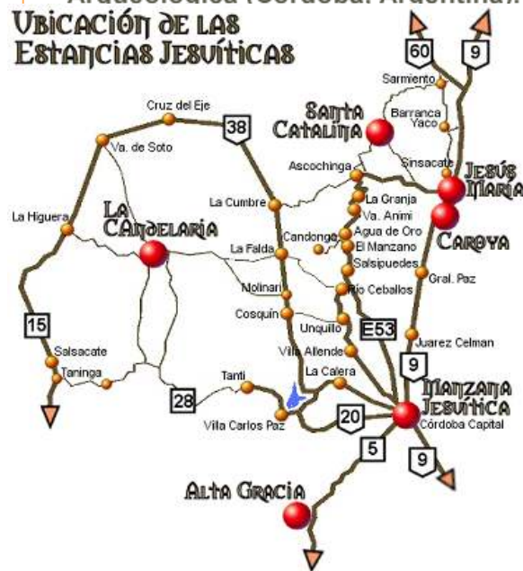
Fig. 12. Plano de la región con las estancias jesuíticas declaradas como Patrimonio de la Humanidad (de: http://www.vallepunilla.com.ar/jesuitas/mapa.htm )

La Formación de una Ruina Histórica : O como la Estancia Jesuítica de San Ignacio paso a ser Arqueológica (Cordoba, Argentina).