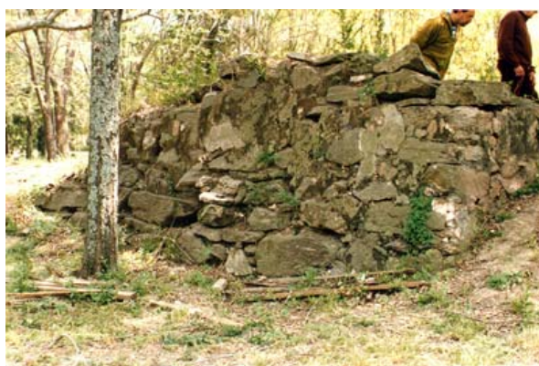
Fig. 7 Restos de los muros de piedra de la iglesia (2003).