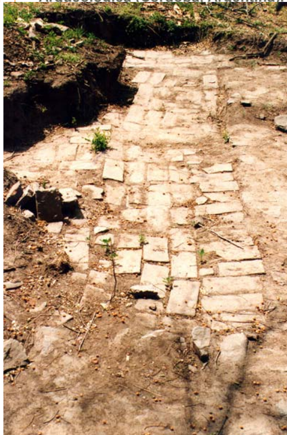
Fig. 10 Vista del piso enladrillado de la iglesia después del saqueo de 1998.

La Formación de una Ruina Histórica : O como la Estancia Jesuítica de San Ignacio paso a ser Arqueológica (Cordoba, Argentina).