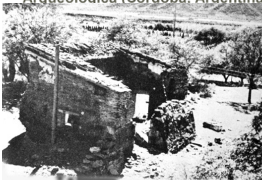
Fig 5 Una de las construcciones del caso de la estancia en pleno proceso de deterioro pero con paredes aun en pie en la década de 1950.

La Formación de una Ruina Histórica : O como la Estancia Jesuítica de San Ignacio paso a ser Arqueológica (Cordoba, Argentina).