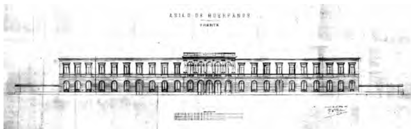
Plano de Fachada