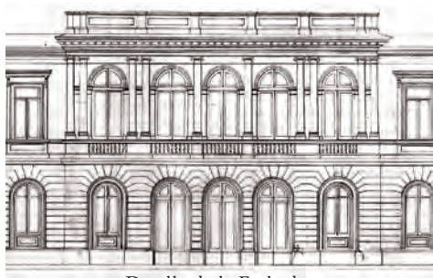
Detalle de la Fachada