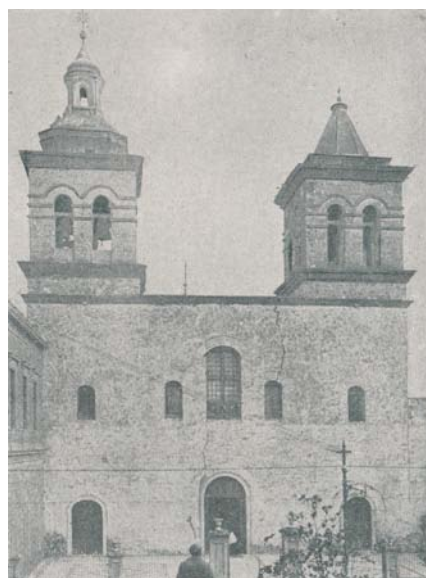
Fig. 1. Esta imagen corresponde al año 1913. Nótese el chapitel del siglo XIX a la izquierda y el original a la derecha. También se puede apreciar la reforma de las aberturas que de arcos carpanel se las transformó en arcos de medio punto y finalmente el revoque con su grieta del lado derecho.

Pero se preveía alguna resistencia al proyecto que se convirtió en un interesante debate, quizás de los primeros en Argentina, en cuanto a la consideración del patrimonio arquitectónico entendido como tal. Por un lado estaban los “progresistas” que querían “restaurar” el frente, pero a la vez enriquecerlo con una ornamentación que pensaban debía ser ostentosa. Por el otro, los “conservadores”, que sustentaban la idea que la iglesia debía ser respetada en la concepción original. En medio de ello había un total desconocimiento de la historia del edificio, incluso de varias intervenciones recibidas posteriormente a la expulsión 3 . La más evidente era que el chapitel del lado sur había sido dañado por un rayo a principios del siglo XIX y se construyó uno mucho más ornamentado que el original, desconociéndose el suceso. Y todos pensaban que ese, por su “belleza”, era el original y había que derribar el prismático de la torre norte, pues debía ser reemplazado por ser menos “estético”. Y así se hizo como veremos luego. Otro tema es que se había revocado la fachada, que por entonces marcaba una profunda grieta 4