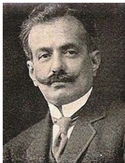
Fig. 4. el gobernador Ramón J. Cárcano durante su primer mandato.

Ambas sufrieron de tuberculosis y murieron en 1931 y 1941, respectivamente. Luego Buffo les levantó una capilla-monumento en homenaje, en las afueras de la ciudad de Unquillo con pinturas murales que no concluye, al fallecer en 1960 (Petriella y Sosa Miatello (s/f).