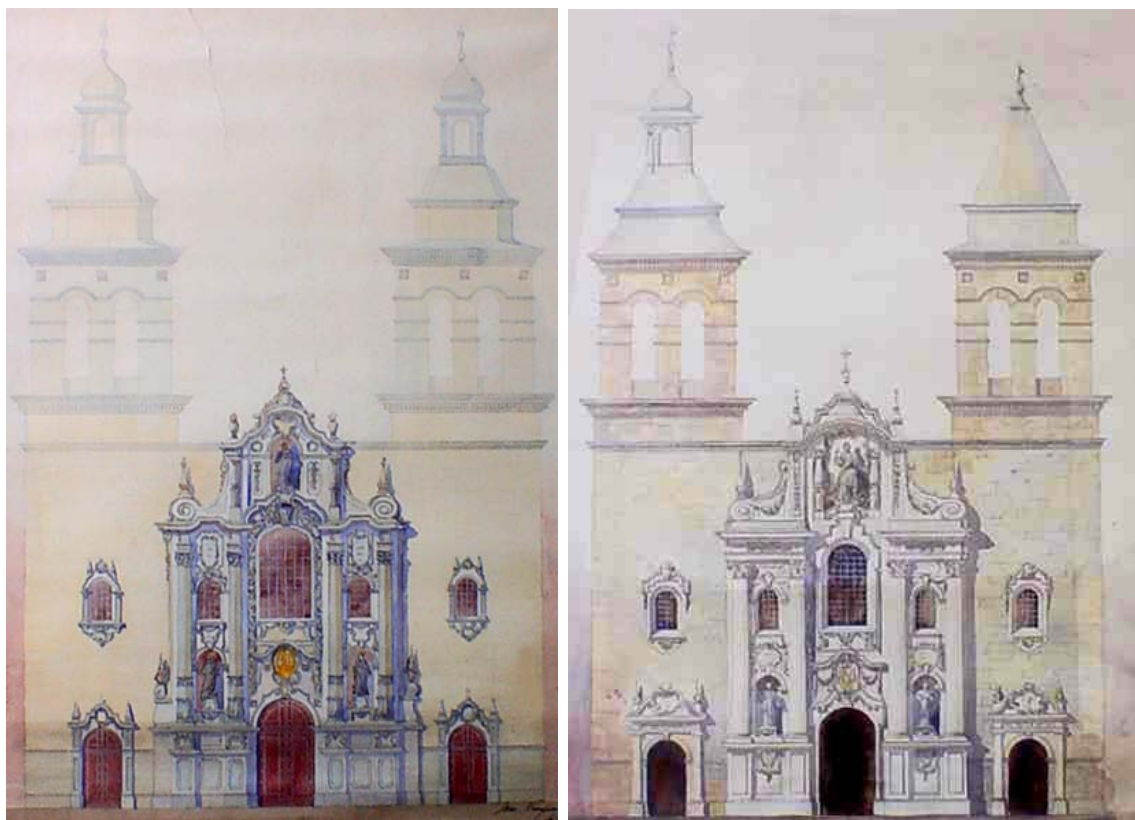
Fig. 9 y 10 Variantes del mismo proyecto rematando con la imagen de San Ignacio.