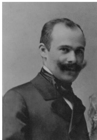
Fig. 3. El arquitecto austro-húngaro Juan Kronfuss en tiempos que llegó a la Argentina.

Incluso Kronfuss a los pocos años manifestó en su conocido libro en la parte que hace una muy poco acertada historia de la iglesia, que en la fachada no se nota “la menor disposición que provea la colocación de adornos para futuros tiempos” 14 . También el propio arquitecto Buschiazzo afirmó en 1942 que era de la misma opinión 15 .