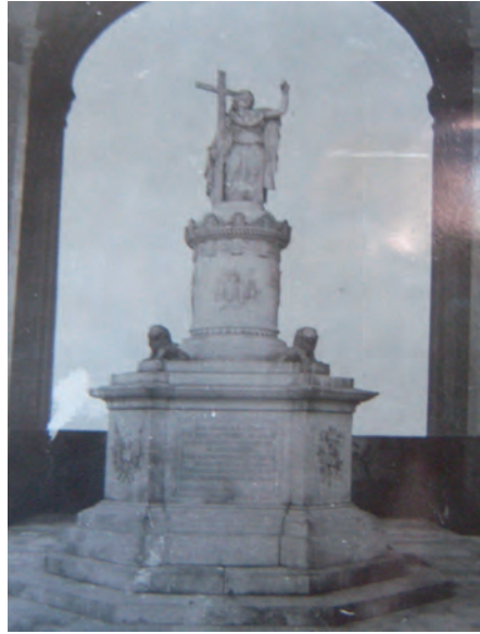
Antigua fotografía de principios del siglo xx. Nótese que aún no tenía el muro posterior con su óculo. Colección Grenón, Archivo Histórico de la provincia de Córdoba, Argentina.