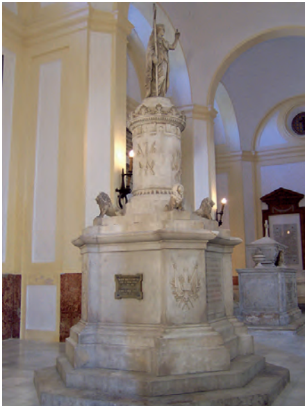
Vista general del monumento a Liniers-Gutiérrez de la Concha en el Panteón de Marinos Ilustres.