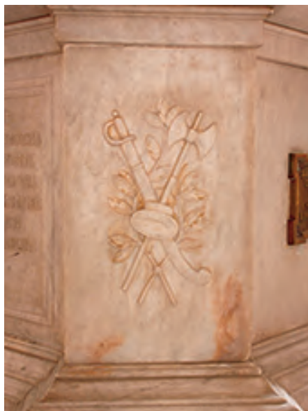
Detalle de la ornamentación del basamento