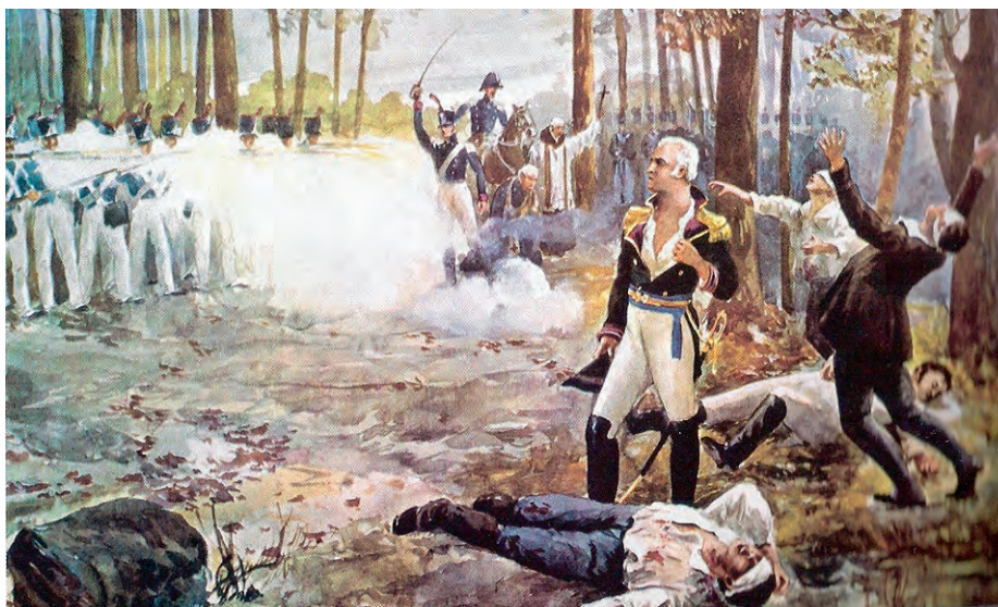
La ejecución de Santiago de Liniers y sus compañeros el 26 de agosto de 1810, óleo de Alfredo Barbier de inicios del siglo xx. Museo de Arte Hispanoamericano Isaac Fernández Blanco.