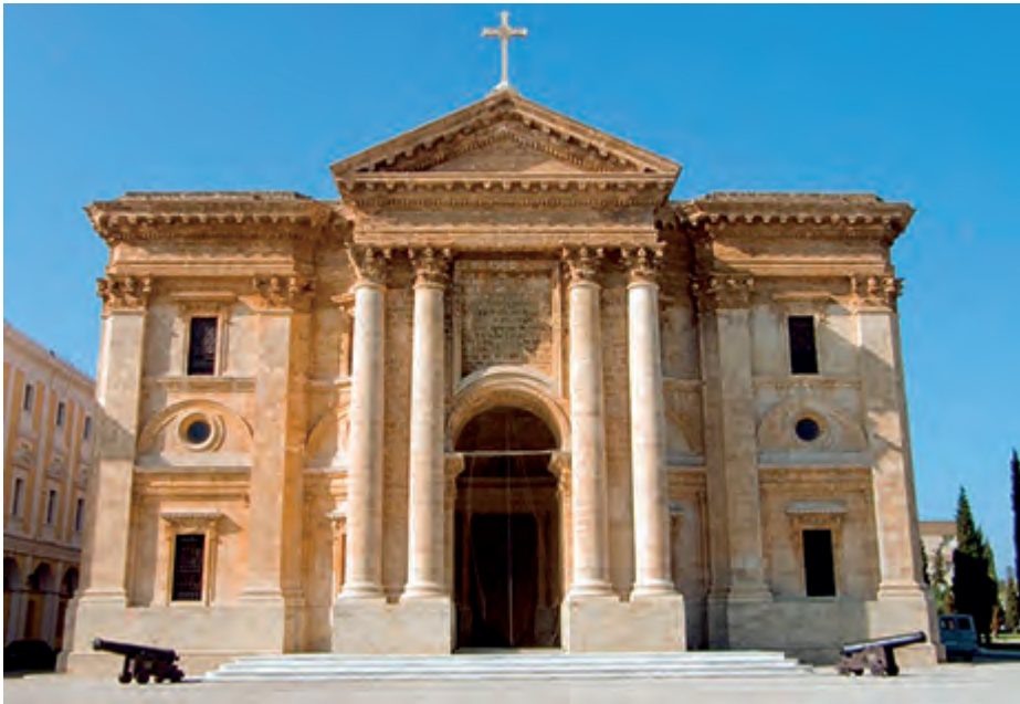
El Panteón de Marinos Ilustres en la actualidad.