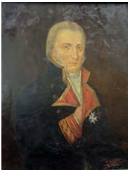
Liniers, óleo de Rafael del Villar. Museo de la Marina del Tigre, Buenos Aires.