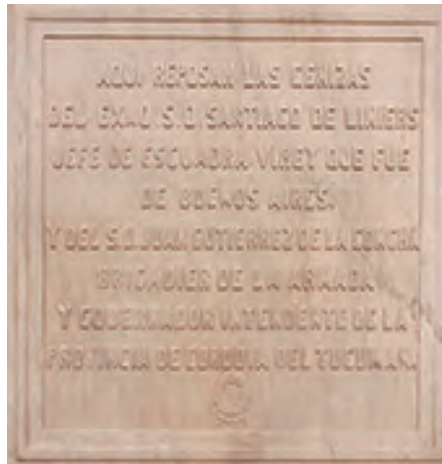
Placa frontal del monumento.