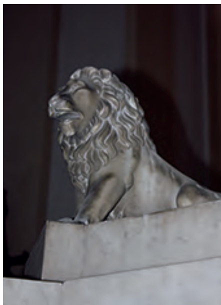
Uno de los cuatro leones que se ubican sobre el basamento.