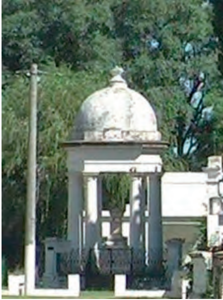
Panteón de la familia Rams y Rubert en el cementerio de Paraná.