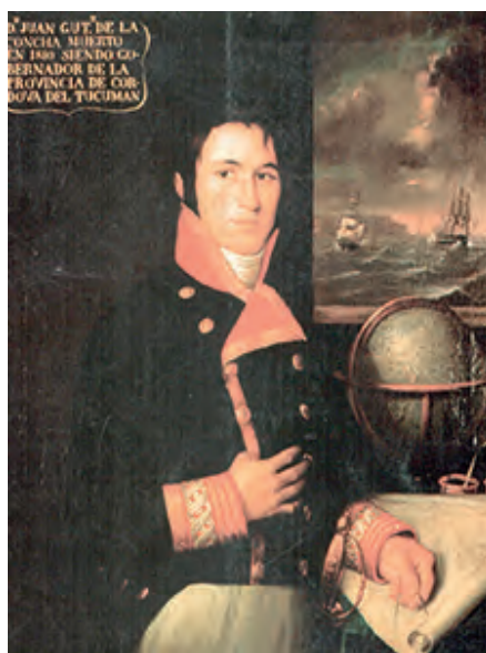
Gutiérrez de la Concha, óleo anónimo del siglo xx. Museo Naval de Madrid.