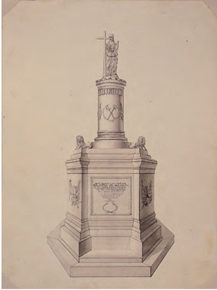
Plano en perspectiva del monumento que presentó el marqués del Duero a fines de 1863. Museo Naval de Madrid.