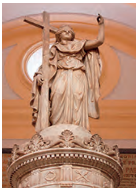
Detalle de la virtud teologal de la fe, que corona el monumento.