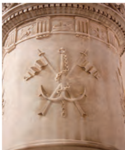
Columna central, que sostiene la virtud teologal de la fe.