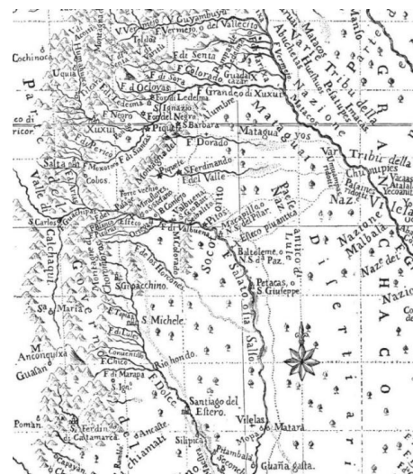
Ilustración 3 Detalle de la región chaqueña del mapa del P. Joaquín Camaño que publica Jolís en su Saggio sulla storia (Furlong, 1936, p. 125).

Martínez de Tineo comentó al virrey la fundación de las dos reducciones (San Ignacio y Dolores) y éste le envió ocho mil pesos para su sustento, pero antes que llegara el